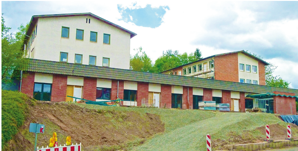
Derzeitiger Baustand am Objekt in Mäbendorf.