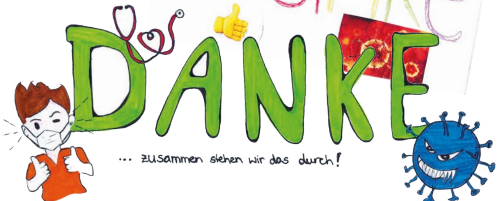
Eine Auswahl der schönsten Einsendungen, mit denen auf besonders kreative und phantasievolle Weise „DANKE“ gesagt wird.

an alle Helfer an alle Berufsleute die im Dienste der Menschen der Gesundheit, der Wirtschaft stehen