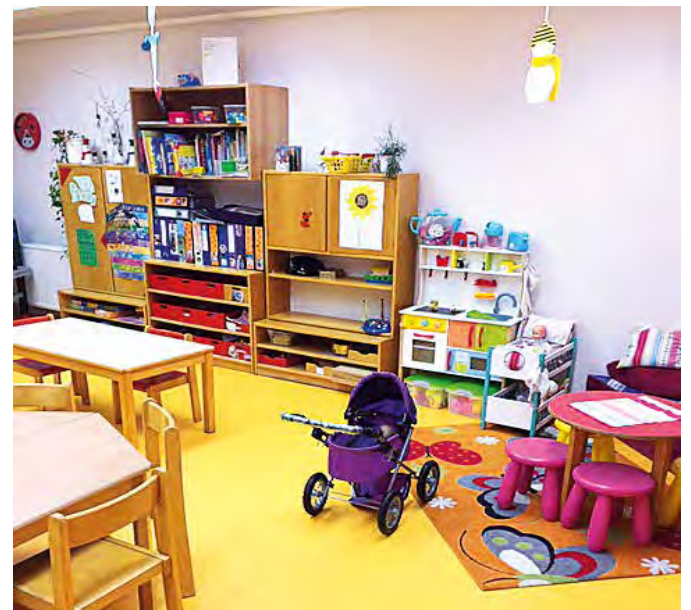
Impressionen aus der Kita „Rennsteigkobolde“, für die es innen wie außen eine Verschönerungskur gab und gibt.