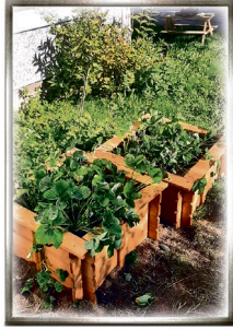
... und der DRK-Kita „Rennsteigkoblde“ in Suhl-Nord.

Annalena Eckardt Kreisleiterin Jugendrotkreuz DRK Kreisverband Suhl e.V.