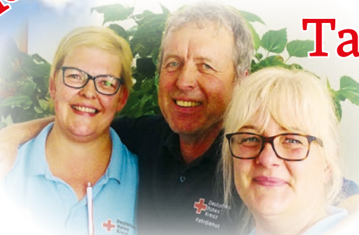
Impressionen aus der DRK Tagesbetreuung „Roseneck“

Die erforderlichen Grundlagen hierfür schaffen unsere Mitarbeiterinnen und Mitarbeiter. Sie ermöglichen den Gästen, sich so aktiv wie möglich am Leben zu beteiligen, ihren Interessen nachzugehen zu können, ihren Tag strukturiert zu erleben sowie eigene Ressourcen zu erhalten und zu fördern.